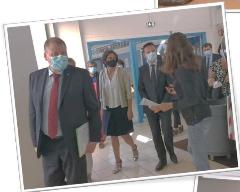
Visite du collège René Cassin, À Ballan-Miré