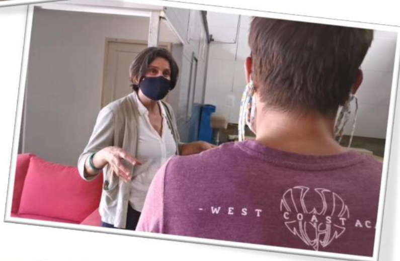
Visite de West Coast Academy, Salle de Parkour, à Joué-lès-Tours

Si vous avez des lieux intéressants à visiter en circonscription à conseiller : cliquez-ici .