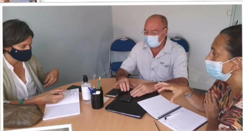
Echange avec l'Apser, À Joué-lès-Tours