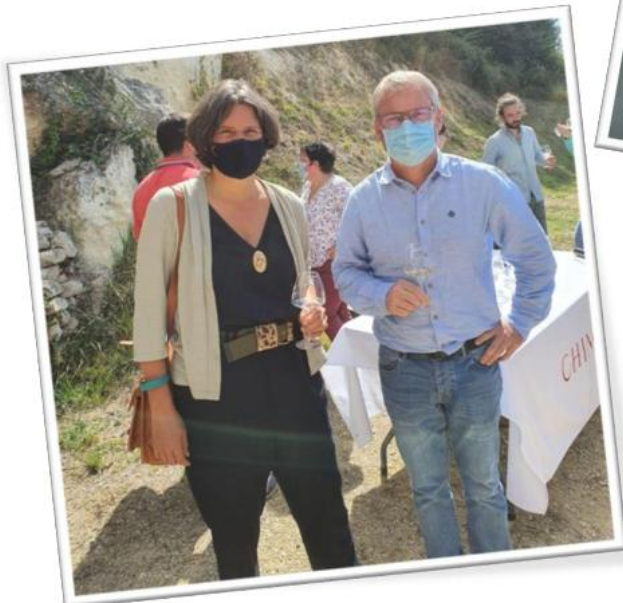
Réunion de pré-vendange du syndicat des vins Chinon AOC