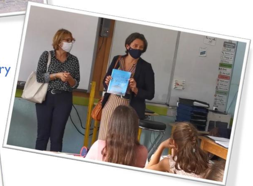
Visite de l'école de Villandry