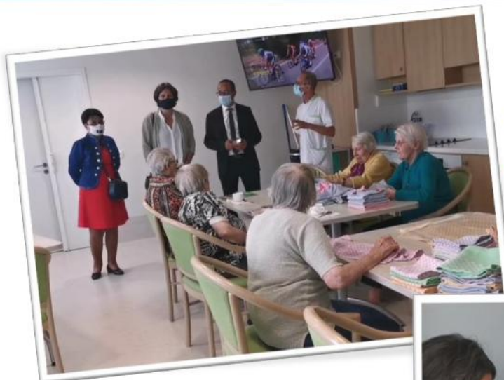
Visite de l'EHPAD Debrou, À Joué-lès-Tours