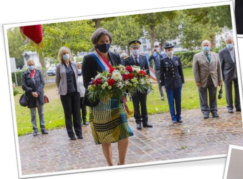
Cérémonie de la libération de la ville de Chinon