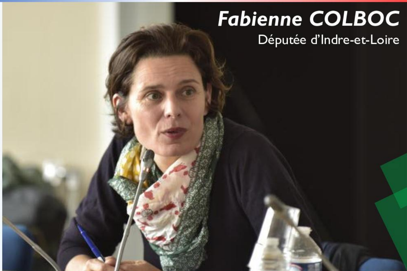
Fabienne COLBOC Députée d'Indre-et-Loire